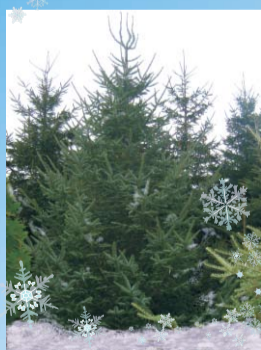
LIELIZMĒRA MEŽA UN FORMĒTĀS EGLĒS 3 - 5,5 m