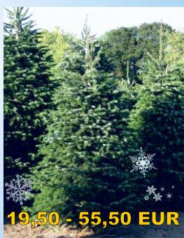
NORDMANA BALTEGLĒS 1.5 - 3.5 m