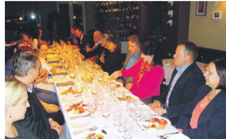
«HOP» vīnu degustācija restorānā «Hercogs»