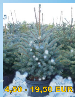
EGLĪTES PODOŠ 0.6 - 1.5 m