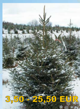
SMUKAS MEŽA EGLĪTES 1.5 - 2.5 m

Atbraucot uz Mārupes, Jelgavas vai Blīdenes Ziemassvētku eglu bāzēm, saņemsiet savai eglītei 20% ATLAIDI!