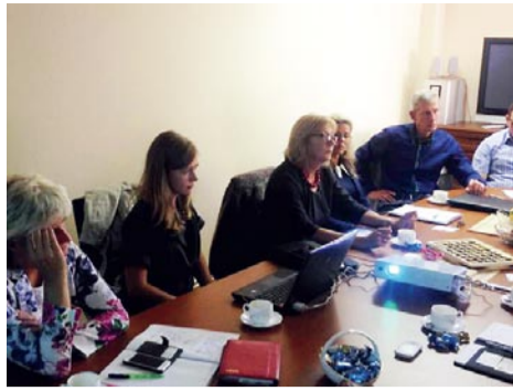
Konkurences padomes pārstāves septembra sākumā tikās biedrības «Mārupes uzņēmēji» dalībniekiem SIA «Silja» telpās.

Septembra vidū pie biedrības «Mārupes uzņēmēji» dalībniekiem viesojās Konkurences padomes pārstāves S. Ābrama un S. Kuplā. Semināra galvenā tēma bija Konkurences likuma dominējošā stāvokļa ļaunprātīgas izmantošanas aizliegums, kā arī jaunais Negodīgas