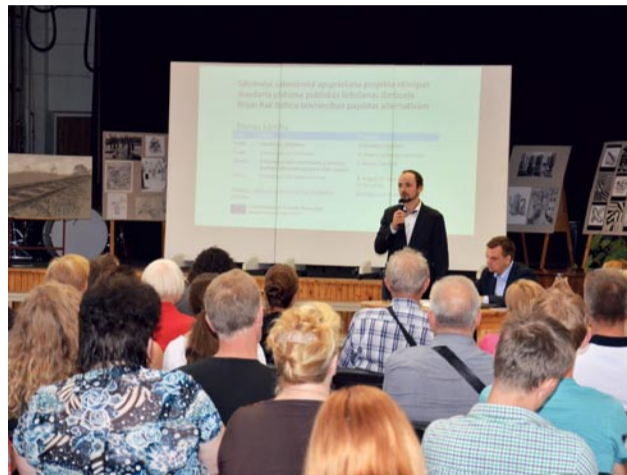
17.septembrī Mārupē notika projekta Rail Baltica papildus alternatīvu sabiedriskā apspriešana.