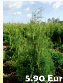
5.90 Eur TŪJAS „BRABANT“ H: 100 cm

Sekoiet tūju, augļu koku un dekoratīvo krūmu kailsakņu akcijām mūsu mājas lapā: www.stadiblidene.lv