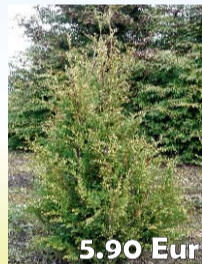
5.90 Eur TŪJAS „AUREOSPICATA“ H: 80 - 100 cm