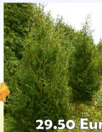
29.50 Eur TŪJAS „BRABANT“ H: 200 - 220 cm