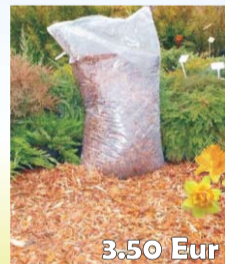
3.50 Eur VIDĒJĀS FRAKCIJAS MIZU MULČA, 80 L MAISS