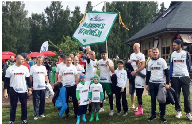
Biedrība «Mārupes uzņēmēji». Komandā ir spēks!

atsevišķu komandu spēlēs piedalījās biedrības loceklis SIA «Bewe RIX» (28. vieta kopvērtējumā) un bijušais biedrības dalībnieks SIA «Wess» (38. vieta). Bez biedrības «Mārupes uzņēmēji» spēlēs piedalījās