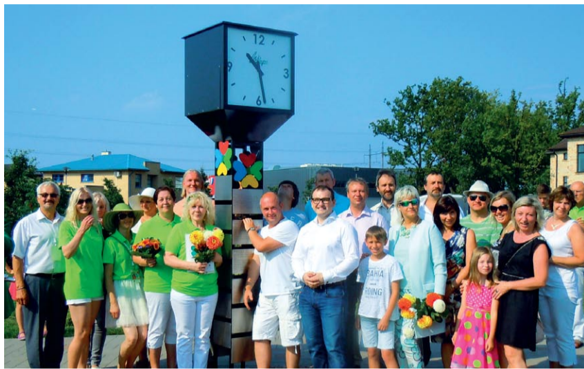
Pulksteņa svinīgā atklāšana 8. augustā: iegriežas uzņēmēju laiks!

8. augustā ar plašām svinībām tika atzīmēta Mārupes novada 90. dzimšanas diena. Viens no svētku atklāšanas galvenajiem notikumiem bija pulksteņa oficiālā atklāšana plkst. 10.00. Bez dāvinājuma biedrība «Mārupes uzņēmēji» arī aktīvi piedalījās novada svētku programmas veidošanā, atbalstot jau tradicionālas auto orientēšanās sacensības – nodrošinot gan balvas, gan atraktīvus kontrolpunktus biedrības dalībnieku uzņēmumos.